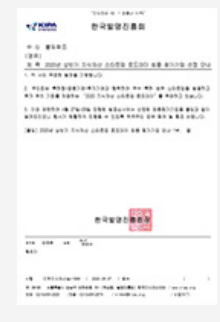
혁신특허사업화지원사업 수혜기업 선정 공문