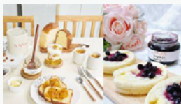
사례 ② S사 잼 제품 인플루언서 마케팅