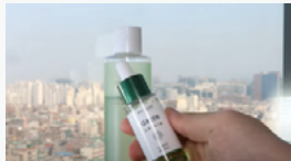
사례 ① A사 화장품 유튜브 브랜드 콘텐츠