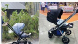
사례 ① D사 유모차 제품 인플루언서 마케팅