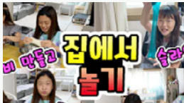
사례 ② L사 식용색소 제품 유튜브 브랜드 콘텐츠